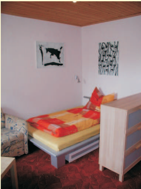
Im Zimmer 1 steht ein großes Bett (140 x 200 cm).

Die beiden Zimmer im Haus Nr. 7 sind jeweils als Wohn-Schlafzimmer ausgestattet mit einem Bett und einem Schlaf-Sofa, einem Schreibtisch, einem Esstisch, Schränken, Fernseher (Kabel-TV), CD-Radio, DVD-Player. Außerdem steht W-Lan zur Verfügung.